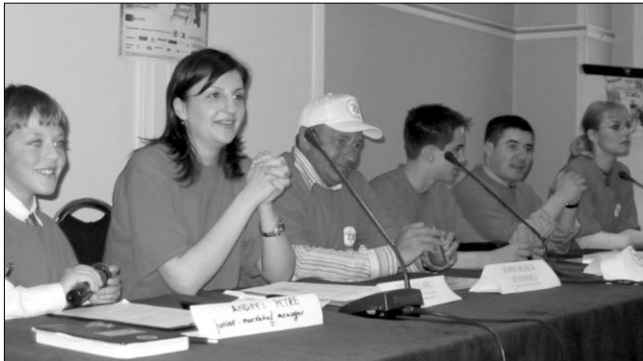
La conferința de presă, toți în uniforme de „pupăză”