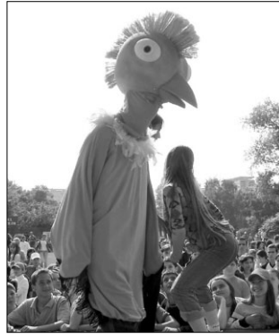
La dans cu mascota