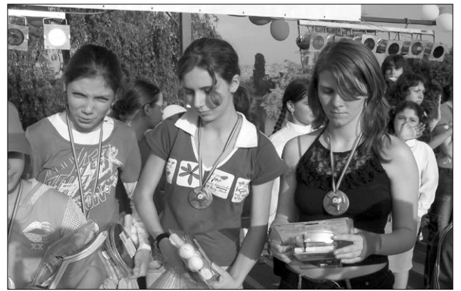
Medaliați la Festival