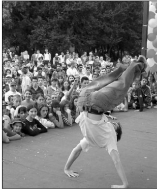
Demonstrație de break-dance