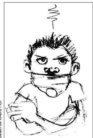
Desen de RADU POP

Din respect pentru elevi și pentru școală nu voi divulga numele profesorului care spune cele mai trăsnete și mai comice perle din tot liceul. Am să încep cu